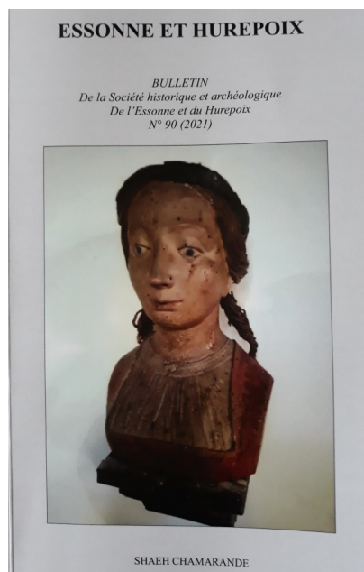
Sainte Ténestine, bois peint du XVIIIe siècle, église de Vauhallan